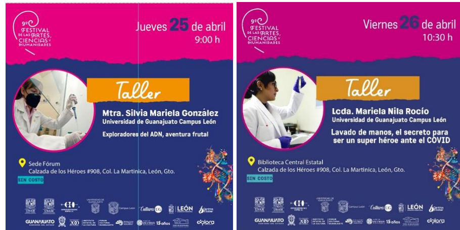
Imagen 11: Promocional de Talleres FACH.

A su vez el personal del LUDIMUG participó en el Festival de las Artes, Ciencias y Humanidades (FACH) con el taller "Exploradores del ADN, una aventura frutal" y con la charla "Lavado de manos, el secreto para ser un super héroe ante el Covid-19" (Imagen 11).