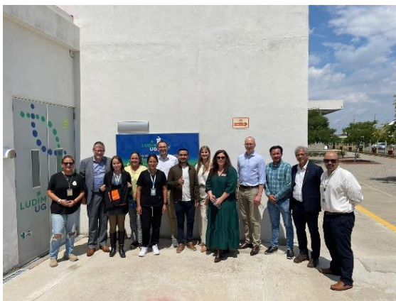
Imagen 12: Fotografía de Memoria Fotográfica LUDIMUG

El personal del LUDIMUG participó en el XXXI Aniversario del CETIS 77, en la Semana Nacional de Ciencia y Tecnología, donde se presentaron las siguientes charlas de divulgación científica: "Del Laboratorio a la Vida: Cómo la Química Transforma la Medicina" y "Huella Genética: El ADN como Testigo Silencioso" (Imagen 13).