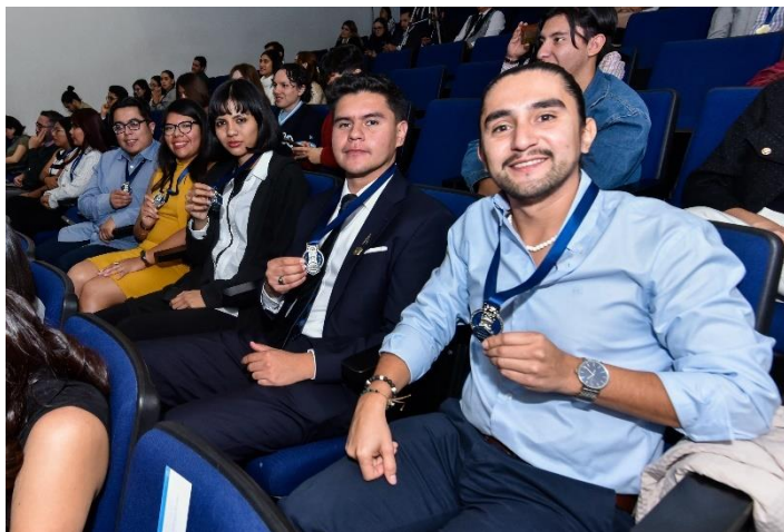
Imagen 2: Memoria fotográfica de la Coordinación de Comunicación y Enlace del Campus León (CCE-CL) "Reconocimiento al Desempeño Académico".

En aras de reconocer el mejor promedio anual del periodo agosto 2023-julio 2024, se llevó a cabo la Ceremonia de Reconocimiento al Desempeño Académico donde 206 estudiantes del Campus León fueron premiados (Imagen 2).