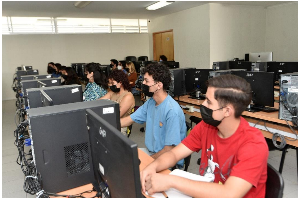
Imagen 6: Memoria fotográfica de la Coordinación de Comunicación y Enlace del Campus León (CCE-CL) "Centros de Cómputo".

Con respecto a la meta PLADI IE-10 Porcentaje de la matrícula del nivel superior que cursa una o más UDA en la modalidad a distancia en línea o semipresencial, el resultado fue de 6.39% de la matrícula de nivel superior en 2024 (Imagen 6).