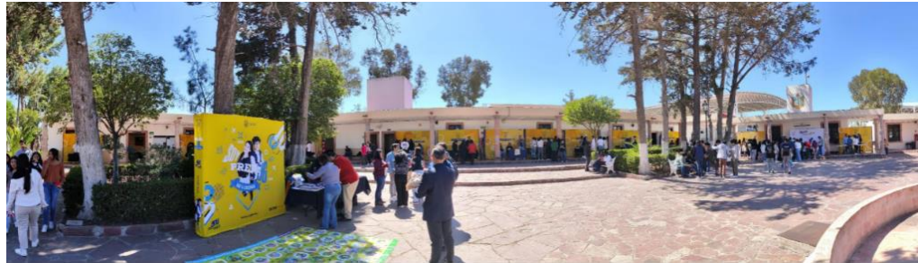
Imagen 1: Memoria fotográfica de Secretaría Académica de Rectoría General "Jornadas de Pase Regulado 2024".

programas educativos y acercar la información a los estudiantes de las 11 Escuelas de Nivel Medio Superior (ENMS), promoviendo así el acceso a la educación superior.