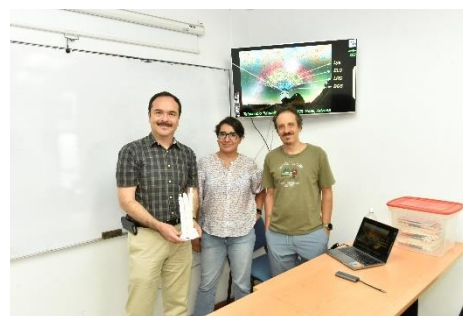
Imagen 5: Memoria fotográfica de la Coordinación de Comunicación y Enlace del Campus León (CCE-CL) "Docentes de Campus León".

En la Consolidación a Niveles II, III y Eméritos en el Sistema Nacional de Investigadoras e Investigadores (SNII) se aprobaron 30 proyectos por un monto total $900,000.00 (Novecientos mil pesos 00/100 M.N.) (Tabla 13).