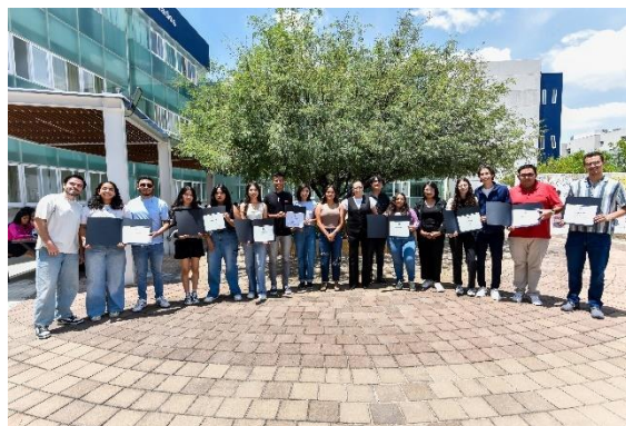
Imagen 4: Memoria fotográfica Memoria fotográfica de la Coordinación de Comunicación y Enlace del Campus León (CCE-CL) "Grupos Organizados".

Se realizó el Festival del Amor y la Amistad con dinámicas como: Amigo secreto; Pócima de amor; colaboración con grupo de teatro LENEAS; Mercadito UG; y presentación musical con grupos estudiantiles.