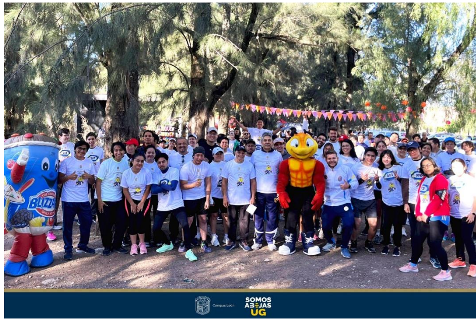
Imagen 3: Memoria fotográfica de la Coordinación de Comunicación y Enlace del Campus León (CCE-CL) "La Primera Carrera DCI: Corriendo o Caminando".

El domingo 24 de noviembre de 2025 en el Parque Metropolitano de León se llevó a cabo "La Primera Carrera DCI: Corriendo o Caminando" la cual ofreció una experiencia única, a los 115 participantes que corrieron 3 km, 5 km o 7 km con causa (Imagen 3). Además de promover el deporte y la convivencia, los fondos recaudados se destinaron a mejorar los espacios para la comunidad estudiantil.