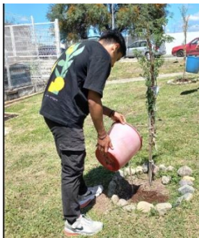
Imagen 17: Fotografía de Memoria Fotográfica de la Coordinación de Calidad Administrativa y Medio Ambiente del Campus León (CCAyMA-CL) "Proyecto Adoptón".

Se organizó el taller "El cuidado del espacio que habitamos: Taller de huertos urbanos", a través de la Mesa Directiva de la Sociedad Estudiantil de la DCSyH del Campus, con apoyo de la Dirección de Medio Ambiente del Gobierno Municipal de León.