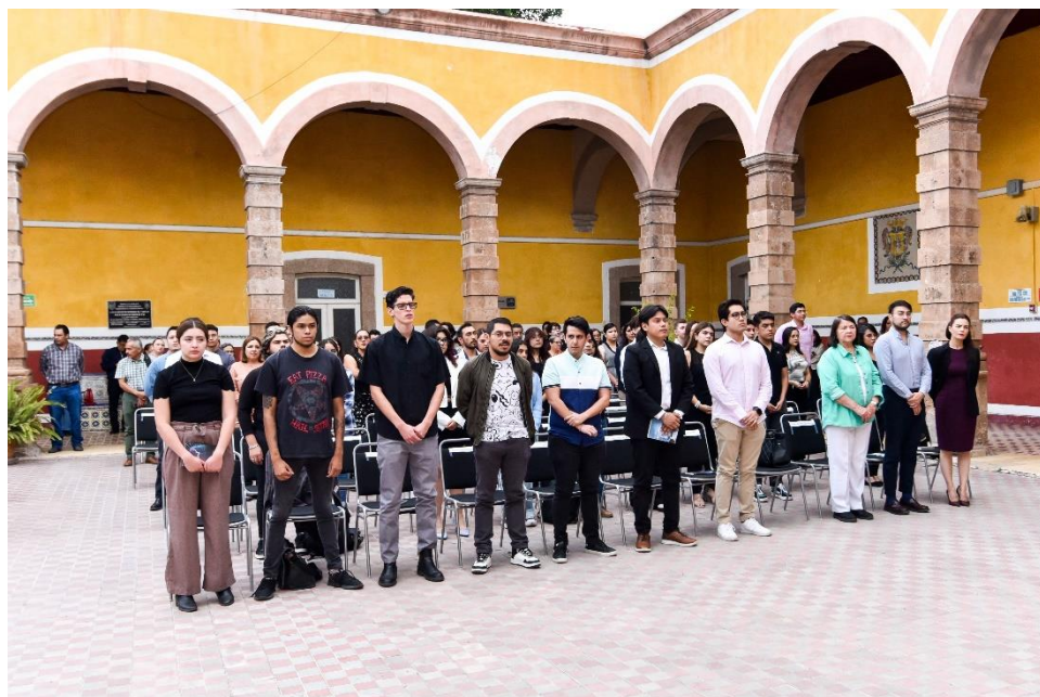
Imagen 14: Memoria fotográfica de la Coordinación de Comunicación y Enlace del Campus León (CCE-CL) "Extensión y Vinculación".

Se llevó a cabo la presentación: Taller de Escucha e Improvisación Musical y del grupo musical de actividades complementarias "Forumcitos" en la sede Fórum de la DCSyH.