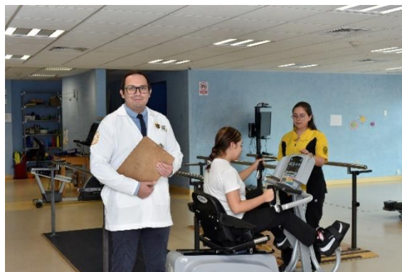
Imagen 8: Memoria Fotográfica de la Unidad Especializada en Rehabilitación Física.

Además, 183 estudiantes de la Licenciatura en Fisioterapia de la DCS realizaron sus prácticas clínicas y se unieron como becarias dos estudiantes de la Licenciatura en Trabajo Social de la DCSyH.