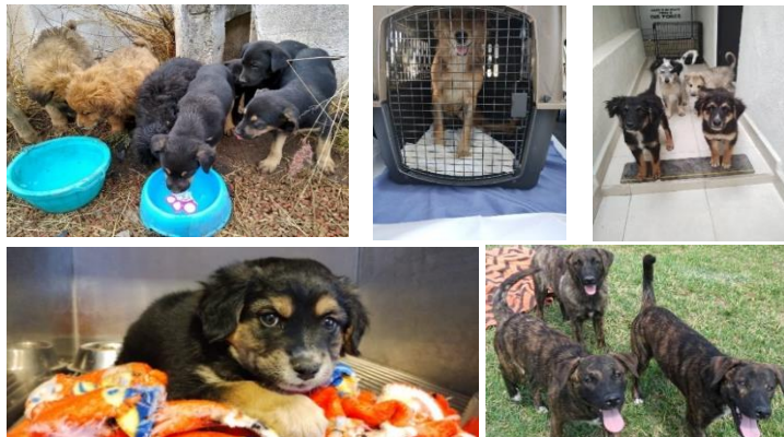
Imagen 7: Collage de memoria fotográfica "Yo también soy UG." Proyecto para el Manejo de Caninos en el Campus León.

Estas acciones reflejan el esfuerzo significativo de la comunidad universitaria para garantizar el bienestar de los perros que habitan en las instalaciones. A través de este programa, se busca proporcionar alimento, refugio y atención médica a los caninos, asegurando que vivan en condiciones dignas. Este tipo de iniciativas fomentan valores como la responsabilidad, la empatía y la solidaridad entre estudiantes, docentes y trabajadores (Imagen 7).