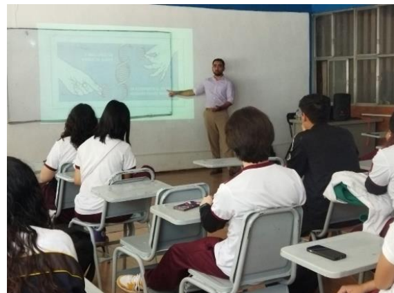
Imagen 13: