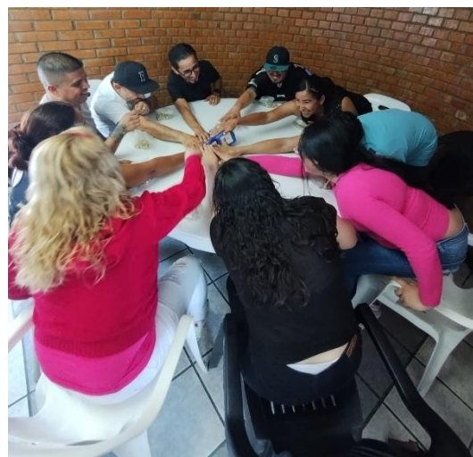
Imagen 9: Memoria fotográfica del Centro de Intervención Psicológica Aplicada al Servicio de la Comunidad.

En lo referente a la vinculación interinstitucional, en el CIPAC se desarrollaron actividades con 35 instituciones entre escuelas, organizaciones y dependencias municipales, por mencionar algunas: Escuela de Nivel Medio Superior de San Miguel (ENMSL); Preescolar Anáhuac; Jardín de niños "Frida Kahlo"; Jardín de niños "Belisario Domínguez"; Jardín de niños "Guillermo Prieto"; Jardín de niños "Rubén Darío"; Escuela Primaria "Pascual Landín"; Escuela Telesecundaria #17; Escuela Secundaria General 14 "Constituyentes de Guanajuato"; Secundaria General 15 "Francisco J. Pichardo Gómez"; Escuela Telesecundaria #491 "La Libertad"; Centro Impulso GTO Contigo Sí; Escuela Telesecundaria #1 "Álvaro Gálvez y Fuentes"; Dirección General de Desarrollo Rural; Parque Santa Ana, A.C.; Manufacturas Diversas; y Dirección del Programa Lobo, en beneficio de 2,061 personas (imagen 9).