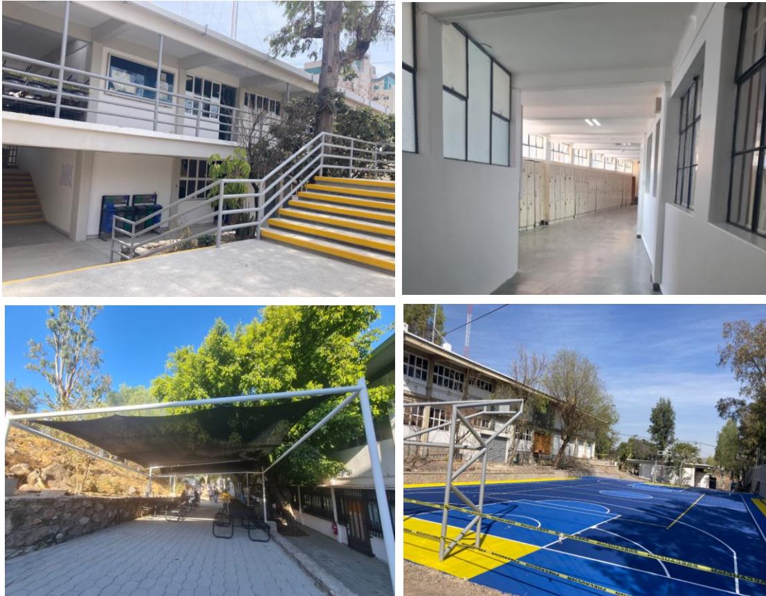
Imagen 16: Collage de Memoria Fotográfica de la Dirección de Infraestructura y Sustentabilidad Universitaria (DISU) "Adecuación de Espacios".